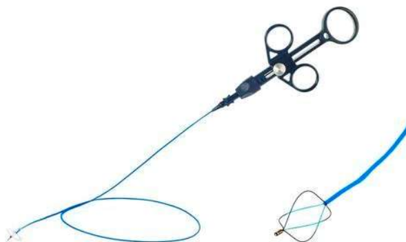
Figura 1: Cestos Endoscópicos em Nitinol para remoção de cálculos Bhio Supply.

A remoção dos cálculos renais é feita pela inserção do instrumental através do canal de trabalho de uma camisa ou endoscópio dentro do ureter ou da pélvis renal. A parte ativa das pinças é constituída por um cesto que se abre e se fecha permitindo ao cirurgião a captura, manipulação, liberação e finalmente a remoção de cálculos e corpos estranhos do trato urinário. O princípio de funcionamento é puramente mecânico através da tração do cesto realizado pela empunhadura do instrumental e controlada manualmente pelo cirurgião. Os diferentes modelos de cestos (parte ativa) visam proporcionar ao cirurgião a escolha adequada conforme tamanho e formato do cálculo a ser removido. Os modelos também apresentam diferentes comprimentos e diâmetros para melhor adaptação a diferentes pacientes e estruturas anatômicas.